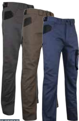
1266 CIMENT 1490 TERREAU 1498 ETINCELLE