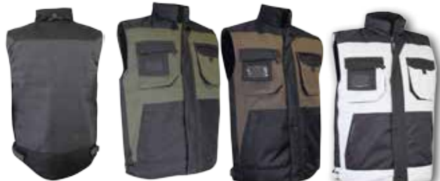
5029 SERPE *