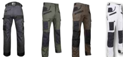
1478 SECATEUR *